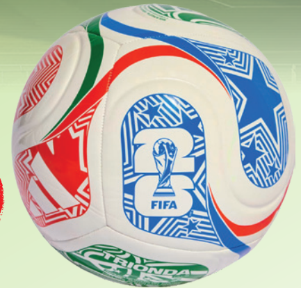
ADIDAS World Cup 26 TRIONDA Club Ball

3x PlastBond 50 ml Doppelkartusche (Art.-Nr. 98350)